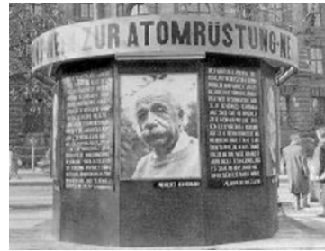
Abb. 2: Informationsstand gegen Atomrüstung 1958.