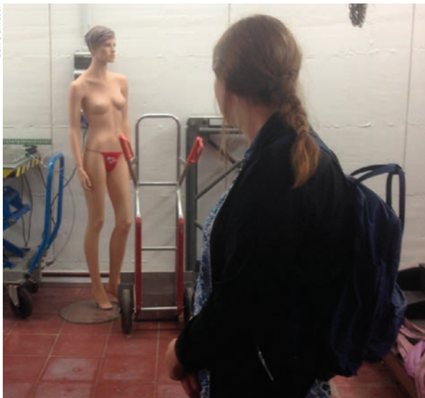
Abb. 2 Unter Mikroaggressionen versteht man Äußerungen, Verhaltensformen oder die Gestaltung der Umgebung, die (un-)beabsichtigt ein ablehnendes und herabwürdigendes Umfeld für Marginalisierte schaffen und ihre Gruppenzugehörigkeit infrage stellen – beispielsweise der Anblick einer halbnackten Puppe in einem Physikkolabor.

tion und den Forschungszielen auszeichnete, fanden sich hingegen in Italien, wo der Frauenanteil bei ordentlichen Physik-Professuren mit 23 Prozent um einiges höher lag.